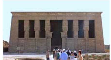
Hathor-Tempel in Dendara

Wo immer wir in Tempeln und an heiligen Stätten sind, werden wir immer versuchen, die Stellen hoher Energie und Schwingung, das Zentrum der heiligen Kraftorte zu erspüren. Wann immer sich auf der Reise die Möglichkeit bietet, werden wir bei den Tempeln in einer ruhigen Ecke meditieren. Da die Zeit beim Besuch der Tempel oft begrenzt ist und die Gelegenheit passen sollte, wird das ca. zweimal der Fall sein.