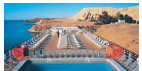
Deck mit Pool der MS Nubian Sea