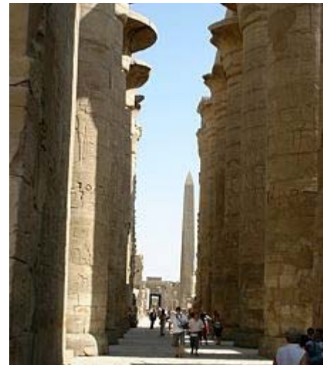
Säulenhalle des Karnak-Tempel

Unsere Ausschiffung ist direkt nach dem Frühstück. Wir machen heute eine Segelbootfahrt mit einer Felluke auf dem Nil zum Botanischen Garten auf der Lord Kitchener Insel . Danach Transfer zum Nasser-Stausee und vor dem Mittagessen Einschiffung in unser 5-Sterne- Nasserseeschiff MS Nubian Sea für 4 Nächte mit Vollpension. Nachmittags besichtigen wir den Kalabsha-Tempel , einen der größten Tempel Nubiens, sowie den Felsentempel Ramses II. in Bet el-Wali und den Kiosk von Kertassi .