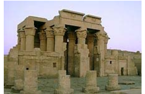
Doppeltempel des Haroeris und Sobek in Kom-Ombo

Für alle diejenigen, die verlängern: Auschecken nach dem Frühstück für die Busfahrt nach Quseir ans Rote Meer. Einchecken am späten Nachmittag in das 4-Sterne-Hotel Pensée Royal Garden 24km südlich von Quseir mit All-Inclusive. Das Hotel bietet einen wundervollen Service, was den Aufenthalt sehr angenehm macht.