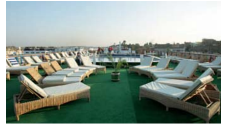
Deck mit Pool auf dem Nilschiff

Für diejenigen, die noch verlängern, ist heute der Abschied gekommen, denn sie werden gleich weiter nach Luxor fahren, um dort noch eine Nacht im 4-Sterne-Hotel Iberotel Luxor zu verbringen auf ihrem Weg nach Quseir. Im Hotel kann man nachmittags noch etwas erholen und baden.