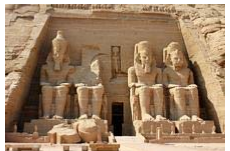
Ramses II-Tempel Abu Simbel