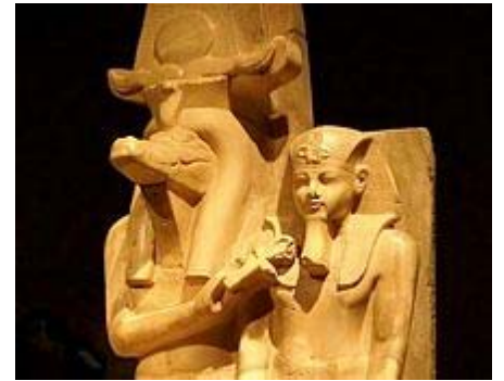
Ägyptologisches Museum Luxor

In den frühen Morgenstunden fährt das Schiff nach Assuan , der Hauptstadt des Südens. Wir fahren nach dem Frühstück mit dem Bus zum großen Assuan-Staudamm . Mit dem Motorboot setzen wir zur Insel Agilkia über und besichtigen den Philae-Tempel der Isis . Isis verkörpert die weibliche Liebe und wir erspüren ihre Schwingung auf der Insel. Wir werden einige Stunden dort Zeit haben. Abends gehen wir shoppen im alten und beschaulichen Bazar von Assuan.