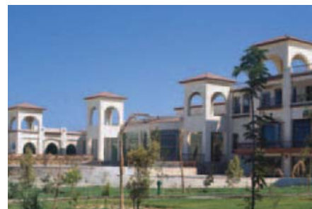
Unser Hotel Pensee Royal Garden in Quseir