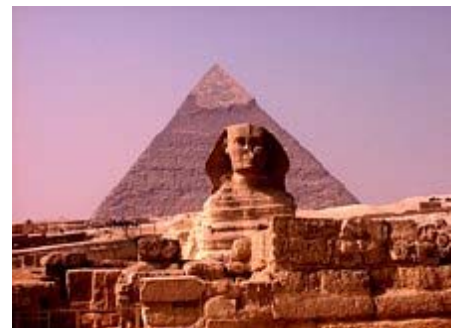
Sphinx vor der Cephren-Pyramide

Vor dem Abendessen machen wir noch einen Spaziergang in der Wüste im südöstlichen Teil innerhalb des eingemauerten Giseh-Geländes. Um ca. 18:30 sehen wir uns die Sound- and Lightshow bei den Pyramiden und dem Sphinx an (leider in Englisch, geht nicht anders, ist auch dann noch sehr beeindruckend), danach Ausklang des Tages beim Abendessen in einem Restaurant in Kairo.