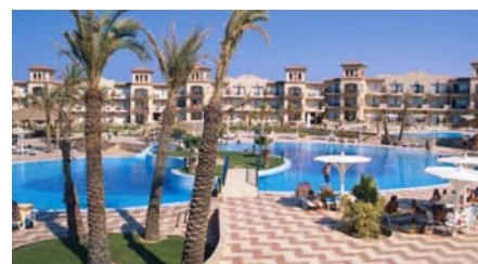
Anlage Pensee Royal Garden mit Pool