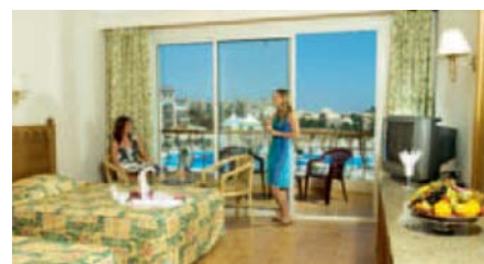
Zimmer im Pensee Royal Garden