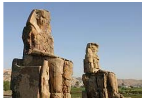
Memnonkolosse in Theben West

Auf unserem Nilschiff MS Miss Esadora haben wir Vollpension. Während das Schiff fährt, können wir uns auf dem Deck sonnen, im Pool baden und uns erholen. Die großzügigen Kabinen auf dem Schiff liegen alle in den oberen Decks. Es gibt also keine Zimmer im Basisdeck, wie sonst üblich. Die Möglichkeit, Einzelzimmer zu buchen, ist leider auf dem Schiff begrenzt.