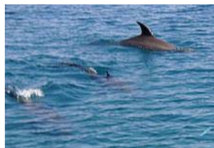
Es gibt freilebende Delphine in Quseir, aber eine Begegnung mit ihnen wäre rein zufällig