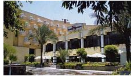
Hotel Mercure Etap in Luxor

Danach Transfer zum Flughafen Kairo und Flug nach Luxor. Transfer zu unserem 4-Sterne-Hotel Mercure Etap in Luxor für 4 Nächte.