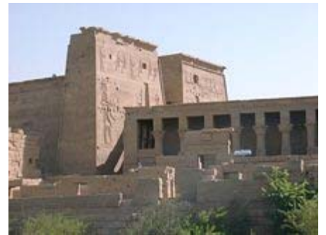
Tempel der Isis, Göttin der Liebe