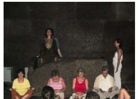
Meditation in der Königskammer der großen Pyramide