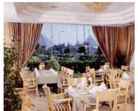
Hotel Mövenpick Pyramids Giseh

Die Anreise nach Kairo von allen, die nicht über Deutschland fliegen, sollte am Sa oder früher erfolgen. Separater Transfer zum Hotel nicht im Reisepreis enthalten.