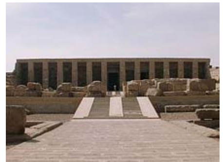
Tempel von Seti in Abydos

Wir fahren morgens zum Westufer nach Theben West und besichtigen einige Gräber im Tal der Könige , den neu restaurierten Hatschepsut-Tempel , den Tempel von Ramses I und den Tempel von Ramses III in Medinet Habu , und die Memnon-Kolosse von Amenhotep III . Wir lassen den Tag beim Abendessen in Luxor ausklingen.