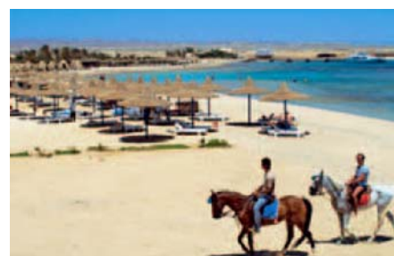
Unser Sandstrand in Quseir