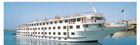
Unser Nasserseeschiff MS Nubian Sea

Komm mit auf eine einzigartige Reise durch Ägypten, die gleichzeitig eine Reise zu dir selbst ist. Fließe mit uns die Wasser des Nils entlang durch deine Chakren den Djed hinunter von der Krone zur Wurzel.