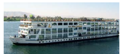
Unser Nilschiff MS Miss Esadora