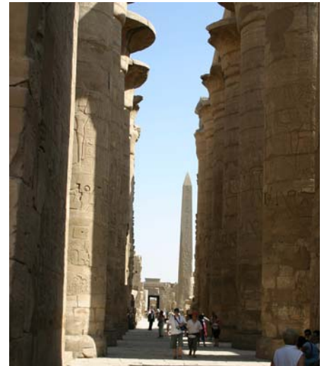
Säulenhalle des Karnak-Tempel

Das Abendessen nehmen wir auf dem Schiff ein.