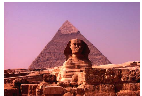
Sphinx vor der Chephren-Pyramide