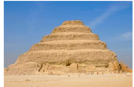
Stufenpyramide in Sakkara