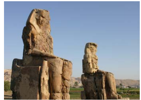
Memnonkolosse in Theben West

Nach dem Mittagessen fahren wir mit dem Bus Richtung Assuan-Staudamm . Mit dem Motorboot setzen wir zur Insel Agilkia über und besichtigen den Philae-Tempel der Isis . Isis verkörpert die weibliche Liebe und diese wundervolle Schwingung ist überall auf der Insel zu