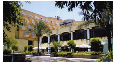
Hotel El Luxor

Nach dem Frühstück checken wir aus unserem Hotel aus. Wir fahren morgens zum Westufer des Nils nach Theben West und besichtigen die Memnon-Kolosse von Amenhotep III , einige Gräber im Tal der Könige , den restaurierten Hatschepsut-Tempel , das Ramesseum von Ramses II und den Tempel von Ramses III in Medinet Habu . Mittagessen werden wir unterwegs in der Nähe der Tempel.