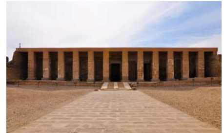
Tempel von Seti in Abydos