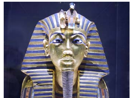
Tutenchamun im ägyptologischen Museum Kairo