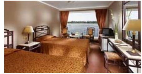
Kabine auf dem Nilschiff

Wir fahren dann für das Abendessen wieder zum Schiff. Abends gehen wir shoppen im alten und beschaulichen Bazar von Assuan.