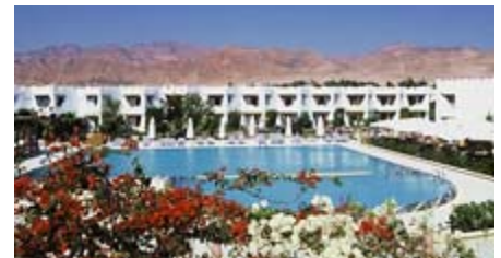
Verlängerung im Swiss Inn Resort in Dahab