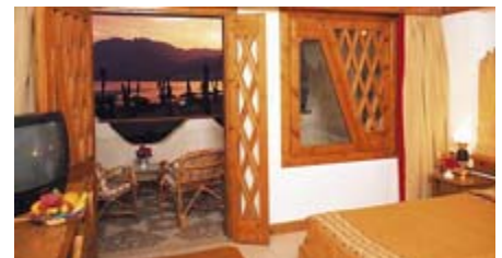
Zimmer im Swiss Inn Resort in Dahab