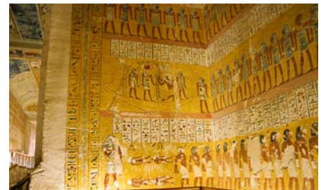
Inschriften in einem Grab im Tal der Könige