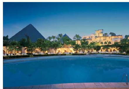
Hotel Mena House Garden Kairo

Wir treffen uns nach dem Abendessen noch für eine Begrüßung und Besprechung der kommenden Dinge, insbesondere des morgigen Tages, des Pyramidenbesuchs. Wir werden das kurz halten, damit sich dann alle ausruhen können.