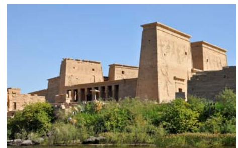
Tempel der Isis, Göttin der Liebe

Für Frühaufsteher (4 Uhr morgens) gibt es eventuell die Möglichkeit, den Tempel bereits vorab bei Sonnenaufgang zu besuchen. Wir klären vor Ort ab, ob das möglich ist. Wir sind dort vom Zeitpunkt her 4 Wochen nach dem 22. Oktober, am dem ein dünner Sonnenstrahl morgens bis ins Allerheiligste dringt und zwei der vier dort sitzenden Statuen erhellt. Das Phänomen ist auch dann noch zu sehen, wenn wir da sind, wenn auch nicht ganz so intensiv.