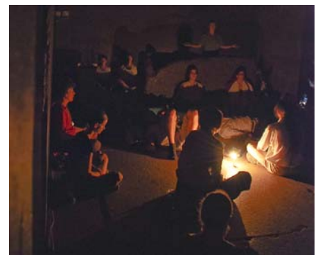
Meditation in der Königskammer der großen Pyramide