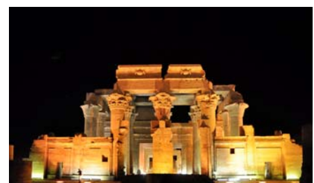
Doppeltempel des Haroeris und Sobek in Kom-Ombo

Heute besichtigen wir die weltberühmten Amun-Re- und Re-Harachte- Tempel des Ramses II und den Hathor-Tempel der Nefertiti von Abu Simbel, die direkt aus dem Felsen gehauen wurden.