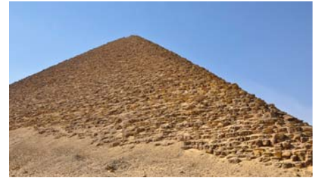
Rote Pyramide in Dashur

Danach Transfer zum Flughafen Kairo und Flug nach Luxor. Transfer zu unserem 4-Sterne-Hotel El Luxor in Luxor für 3 Nächte mit Halbpension.