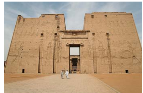
Horus-Tempel in Edfu