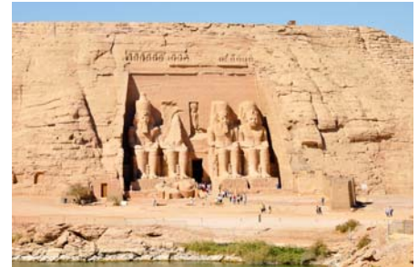
Ramses II-Tempel in Abu Simbel