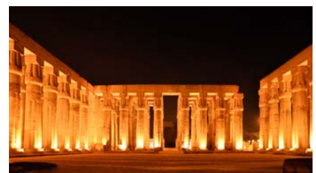
Luxor-Tempel bei Nacht