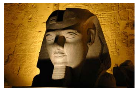
Statue im Luxor-Tempel