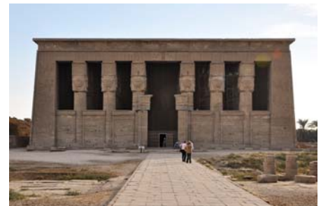
Hathor-Tempel in Dendara