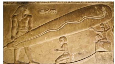
Relief im Hathor-Tempel in Dendara