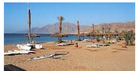
Unser Sandstrand in Dahab